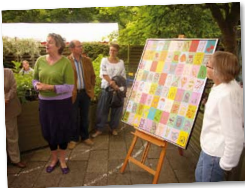
Der blev malet et flot kvindebillede af kunstneren Vibeke Fonnesberg.