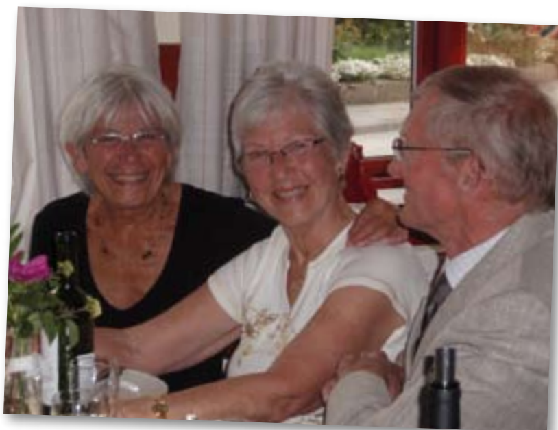
hvor der var arrangeret middag og hyggeligt samvær.